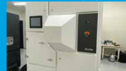
共創イノベーションラボKIBINOVE棟に導入されたクライオモグラフィー装置Arctis

Research Institute for Interdisciplinary Science